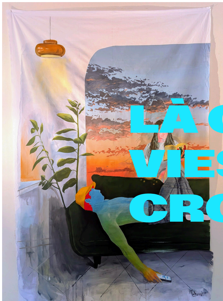
Oeuvre "Douce Histoire" de Tehow