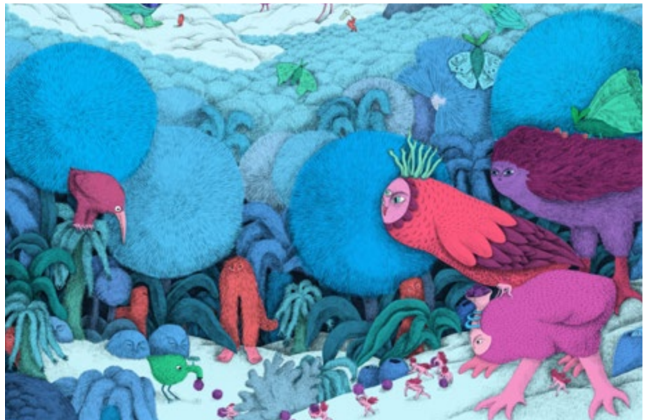
CAPITAINE FUTUR © Juliette Barbanègre