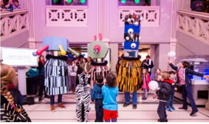
SUPERPARADE Gangpol & Mit