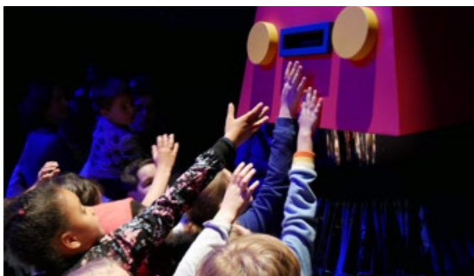
SUPERPARADE Gangpol & Mit / 2018