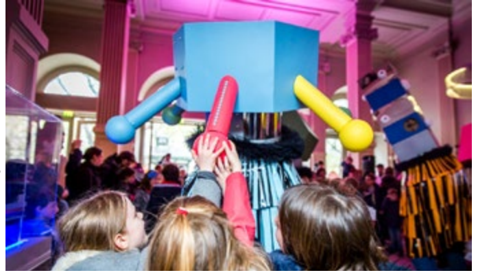
SUPERPARADE Gangpol & Mit